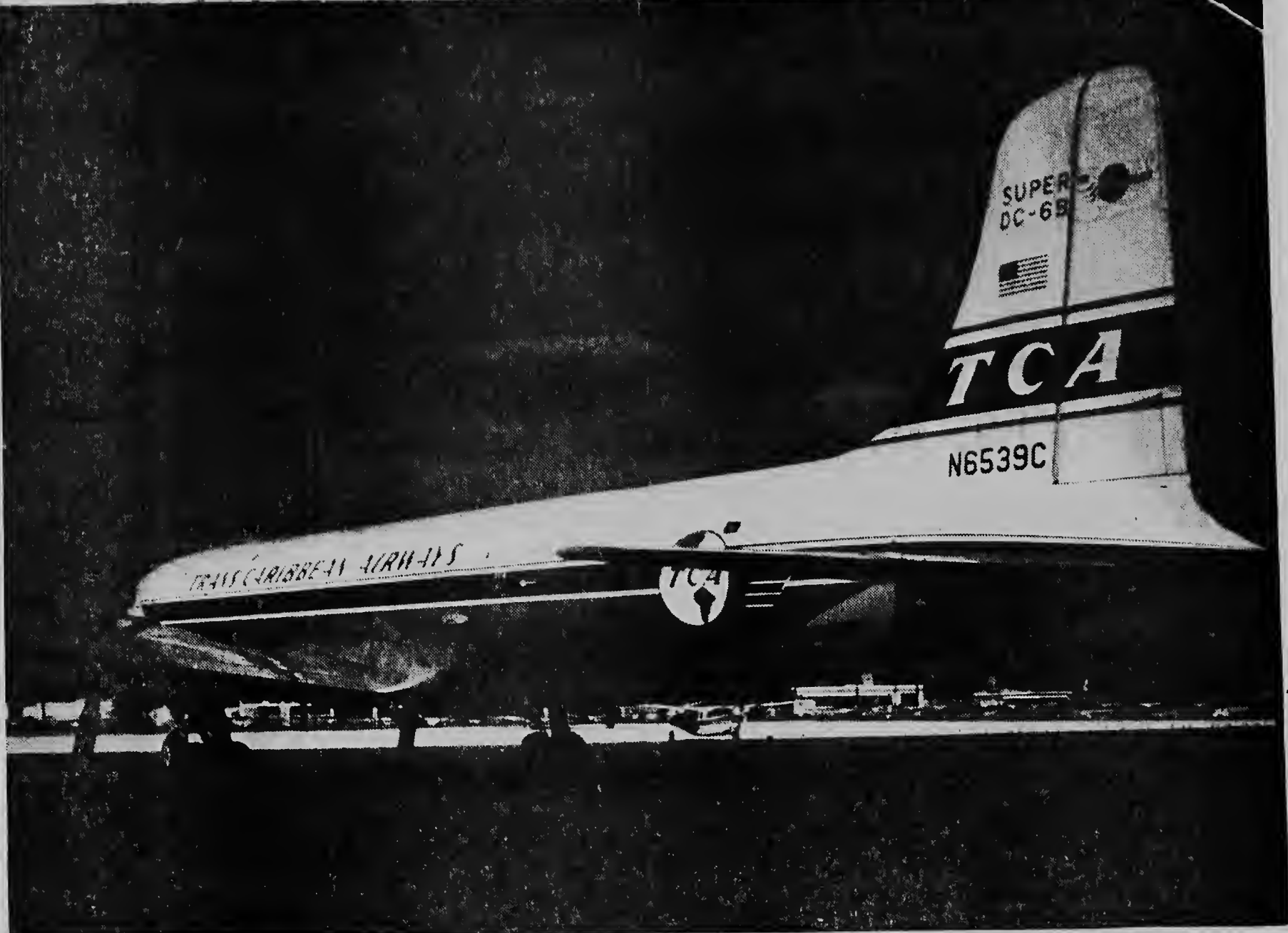
Un excelente fotografia di e DC-6B di Trans Caribbean Airways na e oeropuerto di Puerto Rico.

Puerto Rico no conoce mineralnan. Aparte di industria ta agricultura ta e siguiente fuente di entrada. Especialmente suca ta masha importante. Pero como cu Cuba ta produci suca mas barata cu Puerto Rico, e suca di Puerto Rico ta worde protehe fuertemente riba mercado Mericano cu e tarifanan. Otro productonan importanten di e pais ta tabaco, citrus y coco.